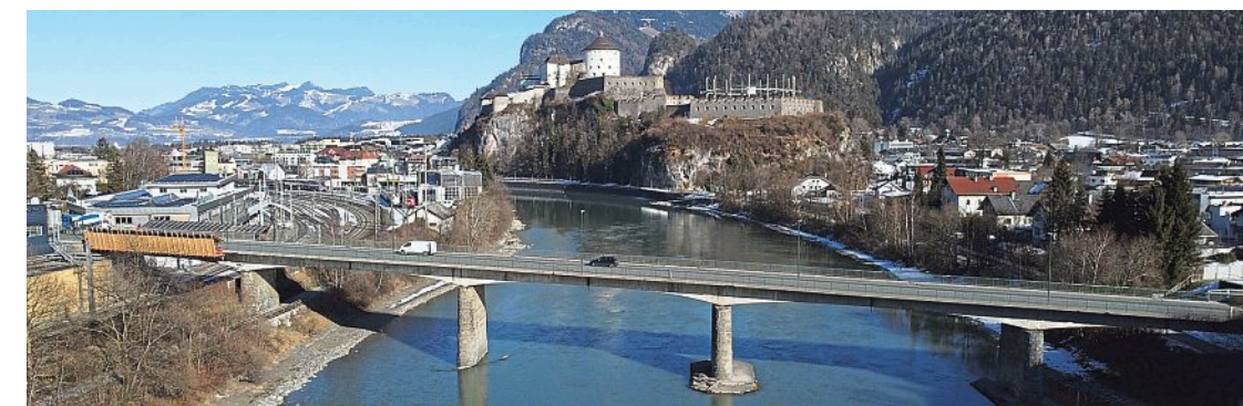
Die Wendlinger Brücke (Kufsteiner Innbrücke) entlang der B 171 Tiroler Straße, ein wichtiger Verkehrsknotenpunkt der Stadt, ist mehr als 70 Jahre alt und muss dringend saniert werden.

Für das gemeinsame Sanierungsprojekt von Land Tirol und Stadt Kufstein werden insgesamt rund 1,8 Millionen Euro investiert.