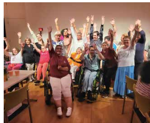
Bilder oben: Die Mitglieder und Ehrengäste genießen die Show der „Manne“queens