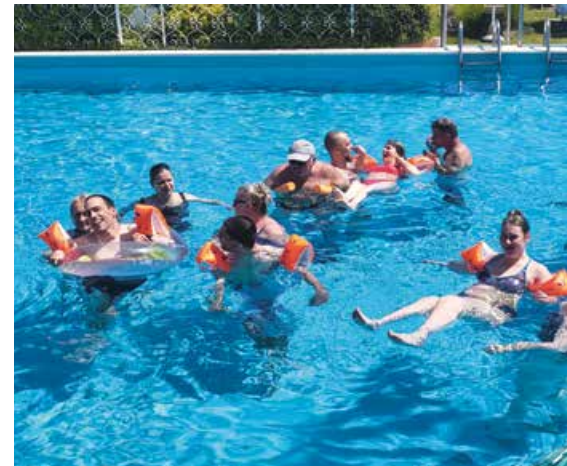
Bild links: Mit dem Rollstuhl ins Meer / Bild mittig: Mit den Rollstühlen durch Venedig Bild rechts: Spaß beim Schwimmen und Plantschen im Hotel-Pool