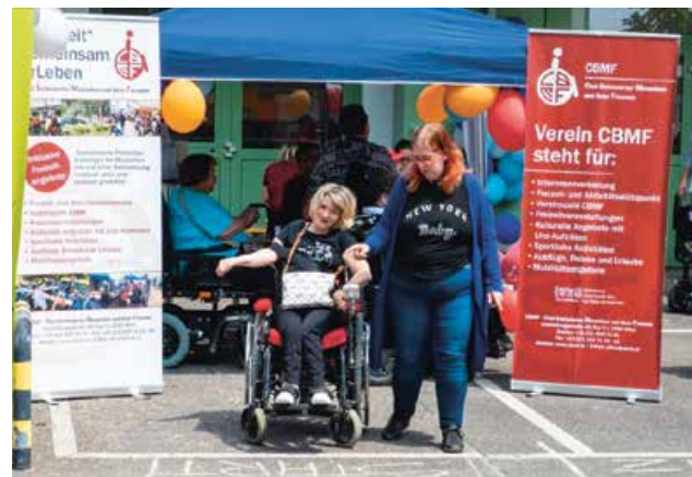
Bilder oben: Sitzungsteilnehmer:innen der „Wiener Gemeinderätlichen Kommission für Inklusion und Barrierefreiheit“ vor unserem CBMF-Stützpunkt / Start und Zieleinlauf des CBMF- Rollstuhlparcours